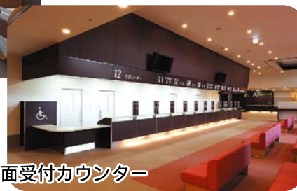
正面受付カウンター