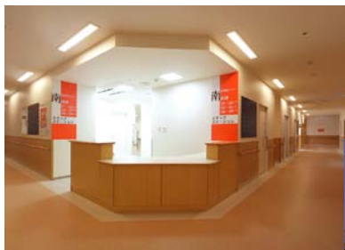
スタッフステーション