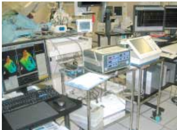
写真1ーカテーテル・アブレーション機材

心房細動は心房に過度な負荷がかかると、引き金となる不整脈（期外収縮）が多くなったり、心房の筋肉が線維に変化したりしてしまうために起こると考えられています。この心房への負荷は心筋梗塞や弁膜症といった心臓疾患に加え、甲状腺疾患、加齢、高血圧、ストレスなどが原因となっています。そのため心房細動の治療は、患者さんの年齢や症状、持病を考え決定していきます。実際に最も多く行われるのは薬による治療です。薬には、①心臓の電氣的なリズムを正常に回復・維持する抗不整脈薬、②心臓の筋肉の炎症を抑え、線維に変化するのを防ぐ薬と③血栓を作りにくくするワーファリンがあり、それらを組み合わせて使用します。しかし、薬物治療では効果がなかったり、副作用などで薬が続けられなかったりする場合も少なくありません。最近では医療技術の進歩もあり、このような場合にカテーテルによる治療ができるようになってきています（写真1）。これは足の付け根より、アブレーション・カテーテルという先端に金属の電極がついた直径2mm程度の管を心臓の中に入れ、不整脈の“巣”になっている部分に高周波の電気を流し、その部分を排除してしまう治療です。心房