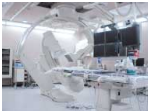
循環器血管撮影室

一番多いのは心臓の病気で、狭心症や心筋梗塞の狭くなった動脈を、バルンと呼ばれる風船やステントと呼ばれる金属の筒を入れて動脈を広げる治療を行っています。不整脈の原因となる部位に高周波を通電して遮断する治療も行っていきます。