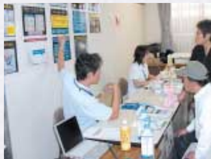
新型コロナウイルス対策を含めた日常生活における感染予防について説明

2日間で431名の方が利用され、盛況のうちにも終わりました。みなさまのご協力に感謝いたします。