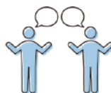
マスクなしでの会話