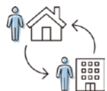
居場所の切り替わり