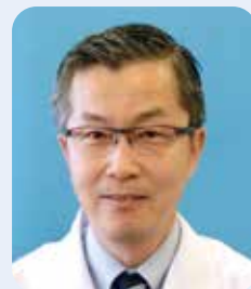
副院長 兼 第4診療部長 兼 救命救急センター長 兼 救急科代表部長