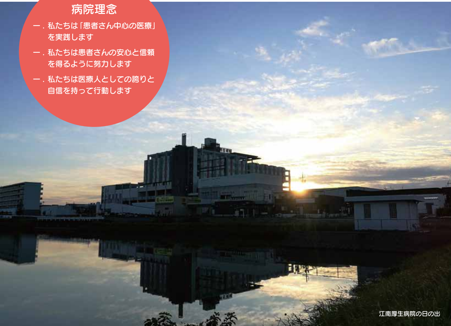
江南厚生病院の日の出