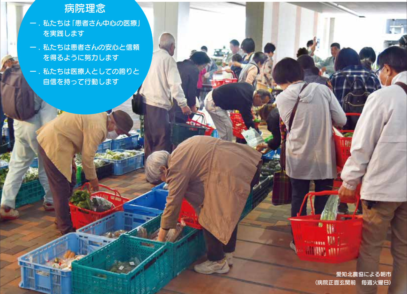
愛知北農協による朝市 (病院正面玄関前 毎週火曜日)