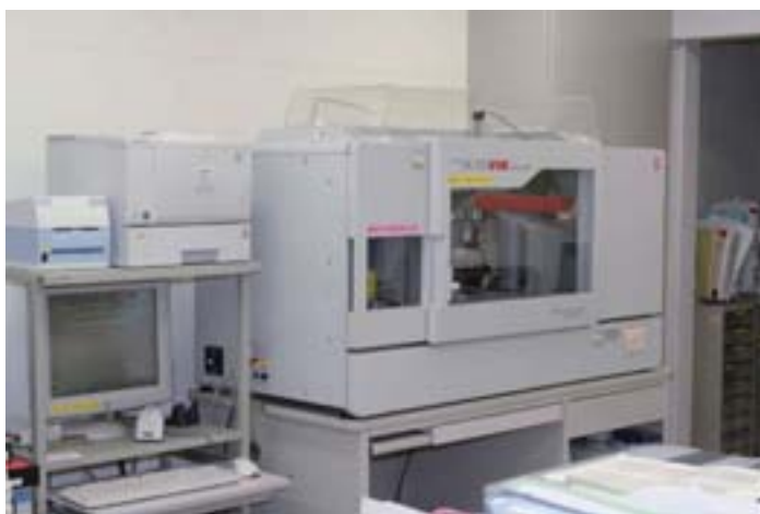
Auto Vue Innova(全自動輸血検査装置)

これからも血液製剤を用いた治療が安全かつ有効に実施されるよう努め、診療科を支援していきたいと思っております。