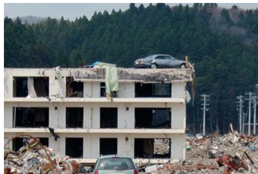
津波の高さを実感した被害状況

東北地方太平洋沖地震への義援金は、皆様のご協力により2,207,466円(職員からの義援金含む)となりました。お預かりしました義援金は全国農業協同組合中央会を通じて、被災地へ贈らせていただきました。ご協力いただきました多くの皆様に心から感謝し、ご報告とお礼にかえさせていただきます。