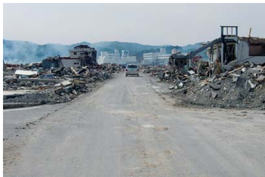
通行可能になった主要道路