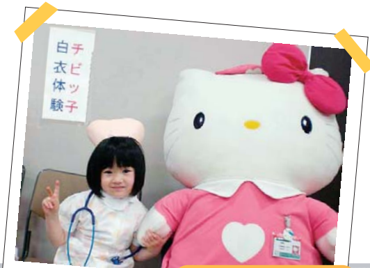
子供白衣試着コーナー