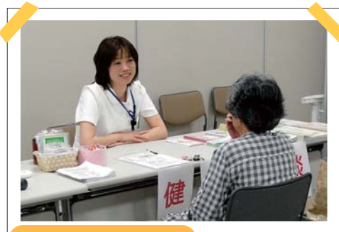
保健師による健康相談

今年も5月10日から4日間にわたり講堂にて第3回看護の日イベントが開催されました。今年は「ずっと忘れられない看護がある」というメインテーマで、看護場面の写真やスライド上映などを行いました。天候不良にもかかわらず150人近くの来場があり、血圧測定、体脂肪測定、禁煙、糖尿病指導などに熱心に耳を傾けていただけました。認定看護師や専門領域の看護師のミニ講座には、興味があるからと3日連続でみえ、とても参考になったという有り難いお言葉もいただきました。子供白衣試着コーナーにはカメラを忘れたと翌日も来てくださったお母さんもみえ、ほのぼのとした中有意義な4日間でした。来場者の中からはもっと早く広域に宣伝して欲しいとのご意見もいただき、来年は色々な点に改善を図り、より地域の方に喜んでいただけるイベントにしたいと思っておりますのでお楽しみに!