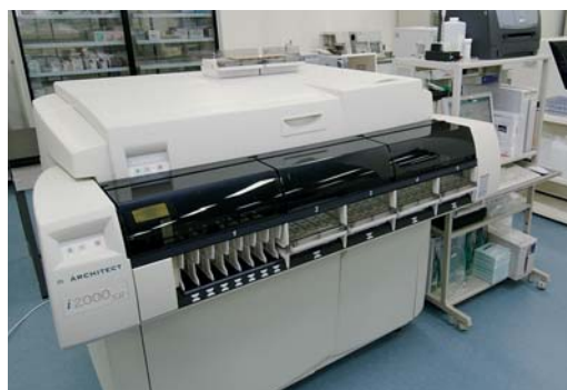
自動免疫測定装置