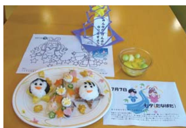
小児食の七夕行事食