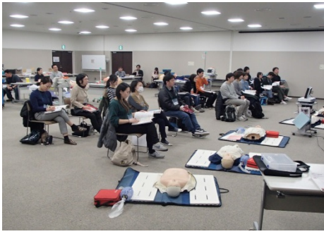
[2017/12/9~10] 日本 ACLS 協会主催『A C L Sヘルスケア プロバイダーコース (2日間)』を開催しました。(受講者 18名)