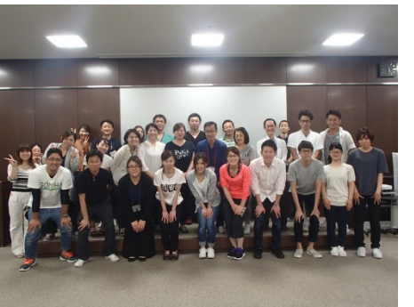
[2017/6/10~11] 日本 ACLS 協会主催『A C L Sヘルスケア プロバイダーコース (2日間)』を開催しました。(受講者 17名)