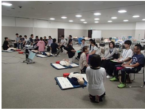
[2018/6/3] 江南厚生病院主催『第13回ICLS講習会』を開催しました。(受講者17名)